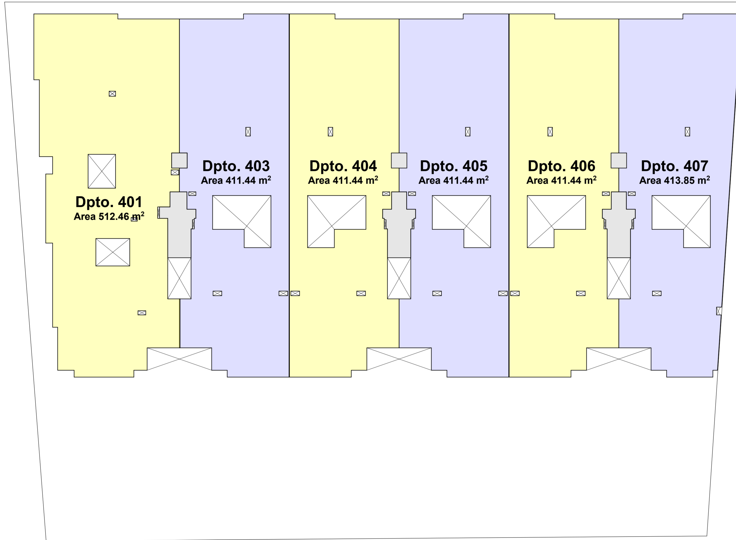
PLANTA CUARTO PISO